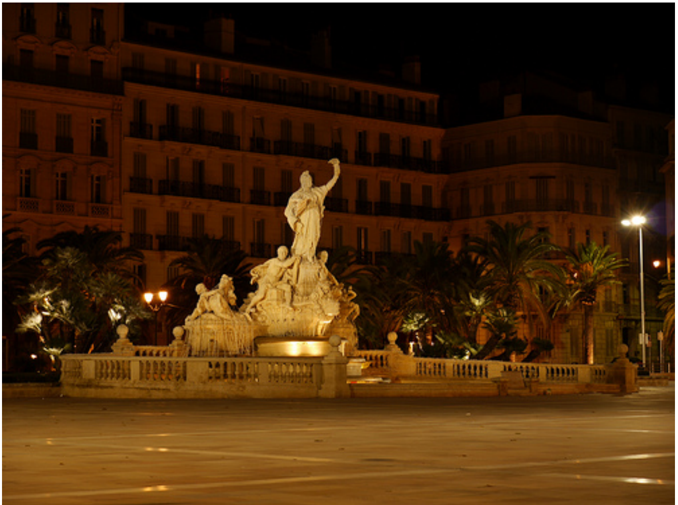
Place de la Liberté dans le centre ville de Toulon